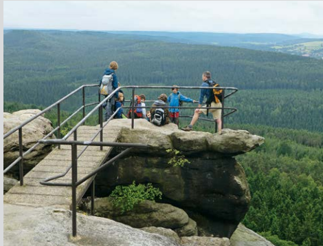
Luftige Aussicht am »Opferkessel«.

gilt für den gesamten Pfaffenstein, dessen Felsenwelt geradezu zum Kraxeln einlädt.