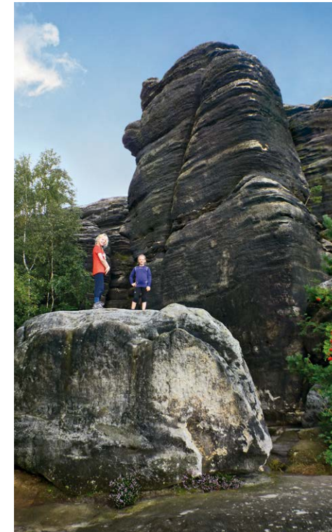
Die kleinen Felsen am Pausenplatz unweit der Barbarine sind beliebte Kletterziele unserer Jüngsten.