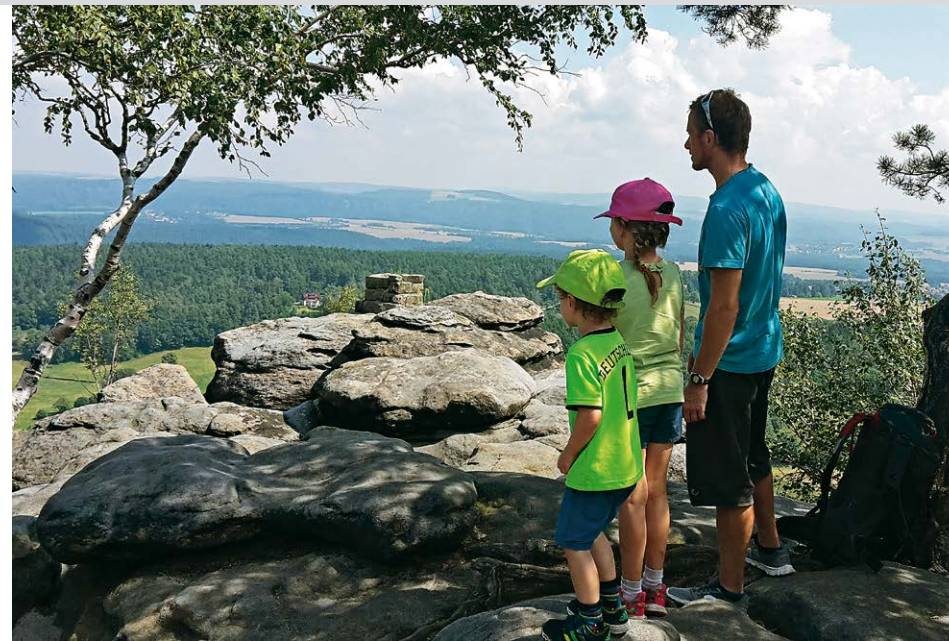
Vom Pfaffenstein haben wir Ausblick in alle Himmelsrichtungen.

Durch das »Nadelöhr« hindurch erreichen wir das Gipfelplateau des Pfaffensteins.