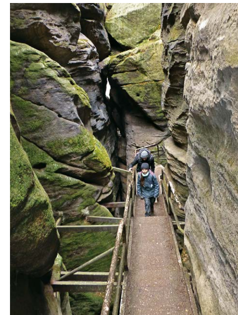
Der »Klammweg« ist sehr beeindruckend.

»Schutzwall« vorbei. Wir laufen noch einige Meter geradeaus weiter und folgen dann dem Weg rechts aus dem Wald heraus. Immer am Waldrand entlang wandern wir mit Blick zum bewaldeten »Quirl« und der Festung Königstein in einer Viertelstunde bis zum uns bekannten Betonplattenweg, dem wir nach links abwärts zum Parkplatz (1) folgen, wo uns ein Brunnen zum ausgiebigen Planschen einlädt.