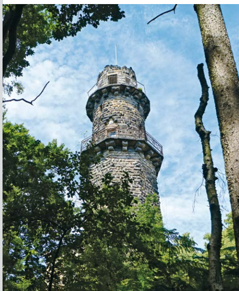
Der Aussichtsturm neben der Berggaststätte Pfaffenstein erinnert an das Märchen von Rapunzel.

Nachdem wir die Aussicht ausreichend genossen haben, wollen wir die Höhle des Geldfälschers erkunden, der hier Mitte des 19. Jahrhunderts sein Unwesen trieb. Gehen wir