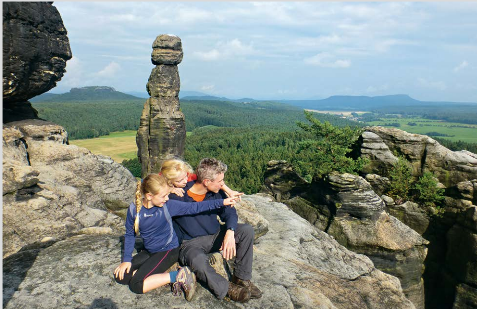
Die Barbarine ist als Wahrzeichen der Sächsischen Schweiz immer einen Besuch wert.

tern gesperrt. Nach mehreren Blitzeinschlägen drohte der Gipfelkopf zu zerbersten, daher erhielt die »Barbarine« eine graue Schutzkappe und eine Halskrause aus Beton, damit wir uns noch lange an ihr erfreuen können. Zurück auf der großen Felsterrasse bietet sich nun endlich ein größeres Picknick an. Kleinere Felsblöcke laden die Kinder zu einer Klettereinlage ein. Nach der Rast wandern wir auf demselben Weg zurück bis zur Berggaststätte Pfaffenstein (5) . Hier steigen wir links den »Klamm-